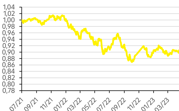
Vývoj hodnoty fondu FWR Strategy 30 EUR