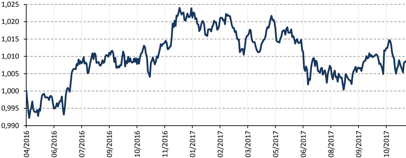
Vývoj hodnoty podílového listu fondu

V souladu se zákonnou úpravou platnou pro oblast kolektivního investování upozorňujeme, že minulá výkonnost fondu nezaručuje stejnou výkonnost i v budoucím období. Hodnota investice a výnos z ní mohou kolísat a návratnost původně investované částky není zaručena. Investice do fondů kolektivního investování nespádají pod režim pojištění vkladů. Úplné názvy fondů a další informace, včetně informací o poplatcích a rizicích obsažených v investicích, jsou k dispozici na www.rfis.cz , ve sdělení klíčových informací a ve statutu fondu.